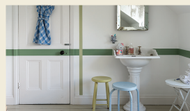
モダンエマルジョン (室内壁用)

非常にきめ細かいチョークの粉のようなマットな質感が光と調和し、室内天井・壁を上品に仕上げます。