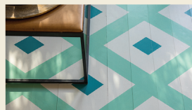
モダンエッグシェル (床・家具用)

水拭きが可能なため、玄関・キッチン・子ども部屋など汚れやすい室内壁におすすめです。