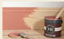
プライマー (下塗り剤)

プライマーとは、塗料を塗る前に塗装表面を整えるものです。より仕上げを丈夫にし、トップコートの色を長持ちさせます。各色、各使用場所に合ったプライマーをご用意しております。