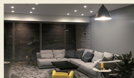
エステートエマルジョン (室内天井・壁用)

非常にきめ細かいチョークの粉のようなマットな質感が光と調和し、室内天井・壁を上品に仕上げます。